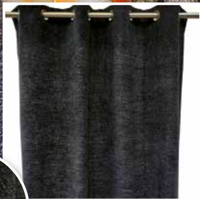
PAP HIMALAYA ARDOISE (7006) 100% polyester

Dimensions des rideaux : 130/140 x 250/260 cm, selon le tissu.