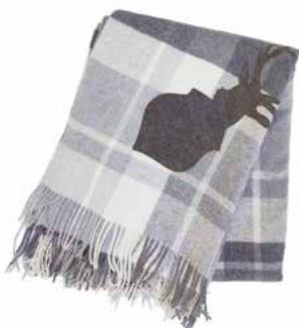
Maribor carreaux/cerf gris