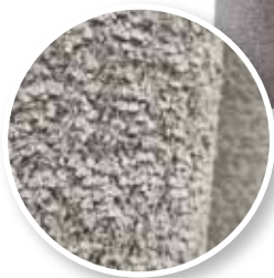
PAP HIMALAYA ECRU (9206) 100% polyester