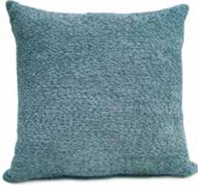
Sherpa aqua (9804)