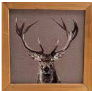
Bois dormant taupe