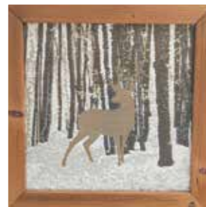
Cerf des bois