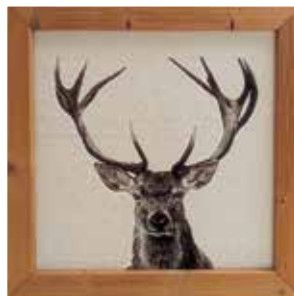
Bois dormant beige