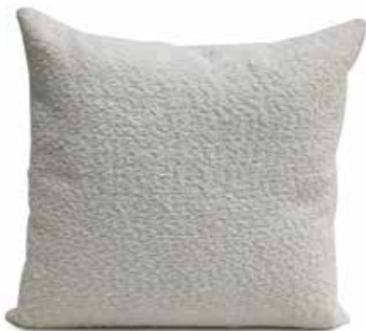
Sherpa ecru (9206)