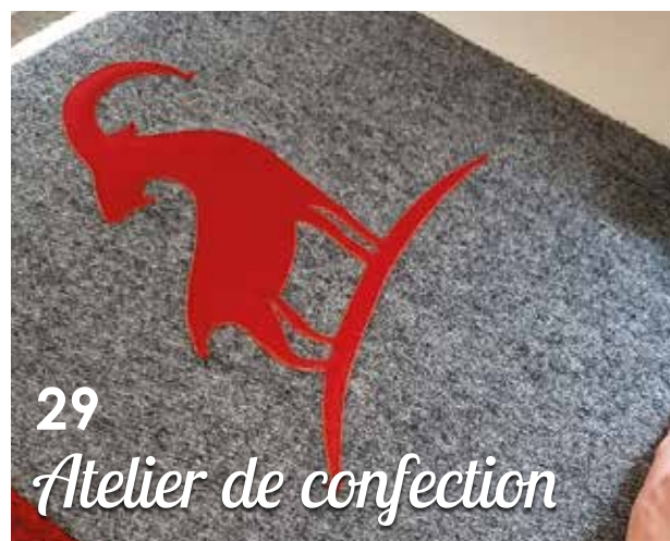
29 Atelier de confection