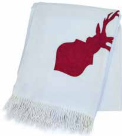
Maribor écru/cerf rouge