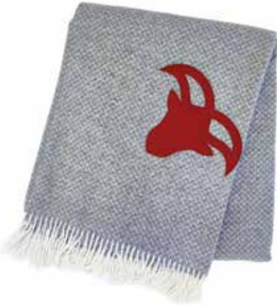
La Clusaz rouge