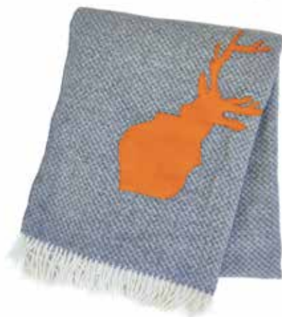
Maribor gris/cerf orange