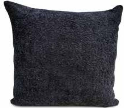
Sherpa ardoise (7006)