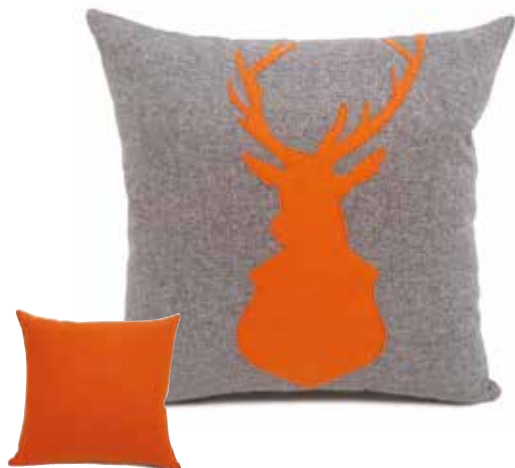
Les Ecrins anthracite