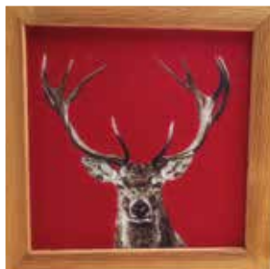
Bois dormant rouge