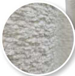
PAP HIMALAYA GRIS (9038) 100% polyester