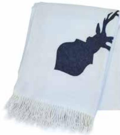
Maribor écru/cerf gris